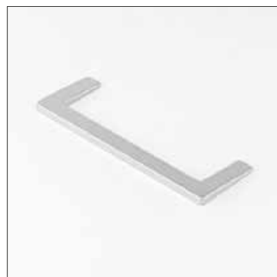
Ручка для розсувної системи SLIM